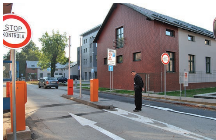
Nový vjezd do nemocnice.

také do centra péče o matku a dítě. V roce 2007 zmodernizovala porodní sály, investice tehdy přišla na téměř 19 milionů korun. Před třemi roky nemocnice zrekonstruovala oddělení novorozenců a šestinedělí.