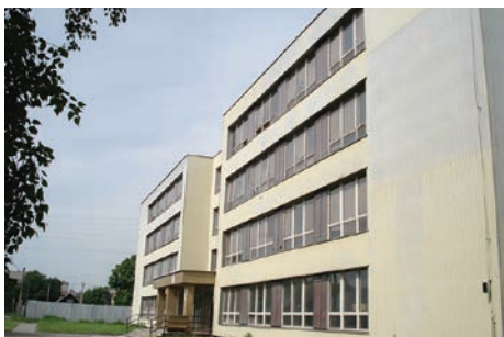
Školní budova před rekonstrukcí...