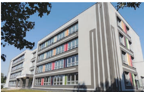
... a po ní.

Střední škola technická a dopravní, Ostrava-Vítkovice, zahájila nový školní rok v nově zrekonstruovaném areálu. V rámci rekonstrukce byly mimo jiné šatny vybaveny uzamykatelnými skříňkami a kamerovým systémem. Do školy nastoupilo celkem 685 žáků, z toho 226 žáků prvních ročníků. Ti se už tradičně zúčastnili dvoudenního adaptačního kurzu na Žermanické přehradě. Kromě toho se škola zapojila do projektu Posouváme hranice jazyků, který zahrnuje nejrůznější aktivity. Patří k nim například téma Čtenářské dílny jako prostředek ke zkvalitnění čtenářství a čtenářské gramotnosti, díky němuž bude školní knihovna doplněna potřebnými knihami. Vybraní žáci se v září zúčastnili jazykově-vzdělávacího pobytu v anglickém Oxfordu, kde absolvovali devítihodinovou výuku anglického jazyka a prohlídky nejznámějších památek Londýna a jiných zajímavých míst Anglie. Další částí zmíněného projektu bude i Stínování (shadowing) pro pedagogy odborných předmětů ve Finsku.